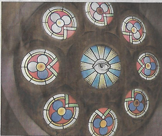
Les verres en eux-mêmes ne devront être remplacés que très partiellement.

Pour plus de détails, on peut se rendre sur le site internet de la communauté : www.communauté-israélite-wolfisheim.com